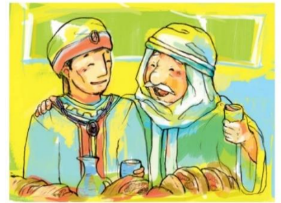
父親關心他說：「這兒子真是死而復活的！」

分。浪子在外面犯了许多罪，不敢讓父親承認他是兒子，因此，他回家後對父親說：「從今以後，我不配稱為你的兒子，把我當作一個雇工吧！」父親卻說：「因為我這個兒子是死而復活，失而又得的。」你願意回轉並相信上帝的兒子耶穌嗎？如果願意，(圖片摘自網路晨光青年網) 就能得著上帝兒子的身分。