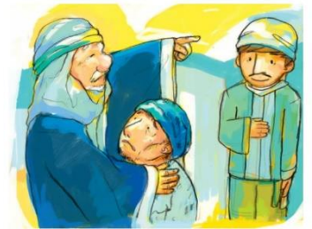
父親憐憫人子「這兒」、「這兒」、「這兒」這兒

兒子重回父親身邊，不僅得到新身分，同時得到了新生命。當浪子回到家後，父親出來迎接，將他身分恢復為兒子，給他換上新衣服，又宰了肥牛犢。兒子的身分代表與父親之間的關係，兒子的生命則代表父親的供給。浪子因為兒子的身分與父親恢復父子關係，並且吃的、用的都是父親給的。