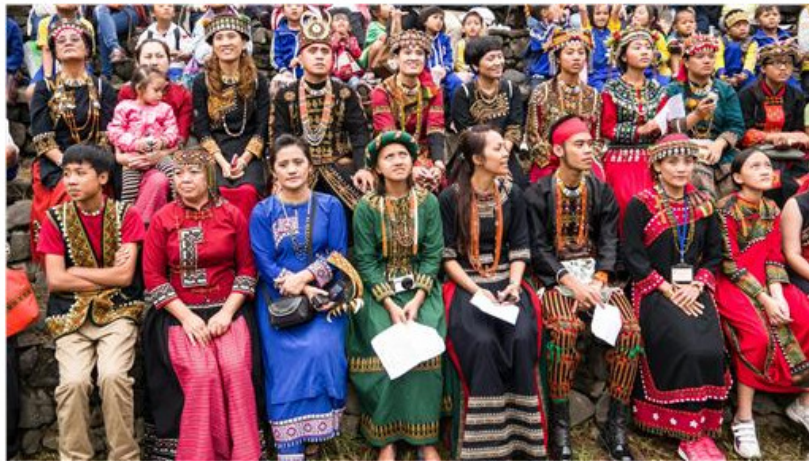
▲原住民部落

於 2008 年由總統陸克文向澳洲原住民族道歉。目前委員會正監督政府和原住民族協議的進展以及監督真相調查的進程。這群原住民族向 WCRC 提出訴求，期望能幫助他們進行公義與和解的行動的支持及陪伴。