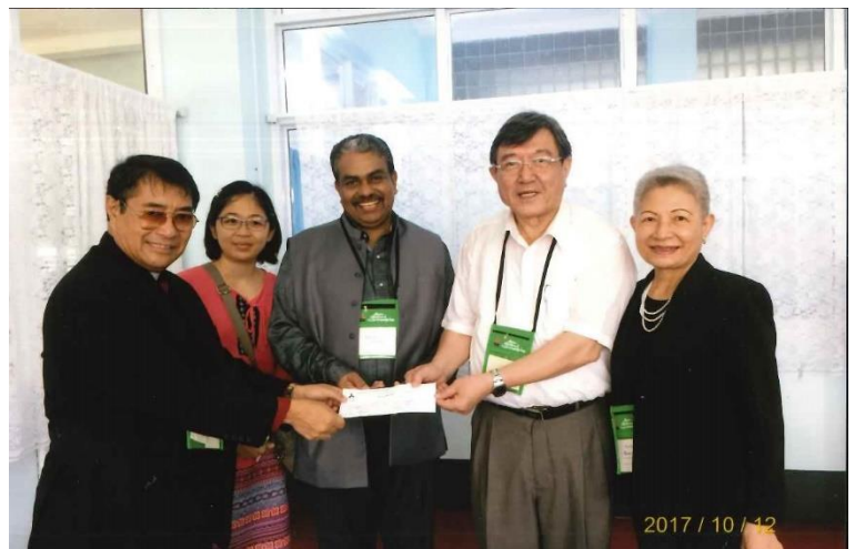
(PCT 為 CCA 捐款，與 CCA 總幹事合影)

緬甸是一貧窮、多元種族、多元宗教、充滿內戰的國家。過去 100 年曾被英國殖民，是亞洲毒品轉運的中介。但人民善良，治安良好。當地講緬甸、英語、華語、福建等語言，月收入約 4-5 千元台幣(2 萬當地幣)。