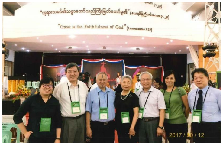
(與台灣全體代表合影)

絕大多數的亞洲教會都有西方差會進駐，好處是得到經濟及神學、組織的支援及指導，壞處是不容易與當地文化及社會融合或參與。此次大會是為提供普世運動的平台，不僅與 WCC、WCRC、CWM、Mission21(原巴色差會)同步做宣教的回顧或悔改，更展望未來有更大能量來發展宣教事工。