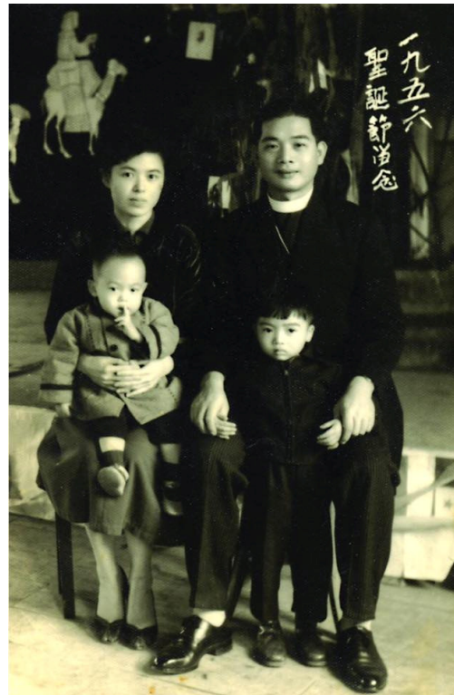
1956 年在頭城教會的最後一次聖誕節留影