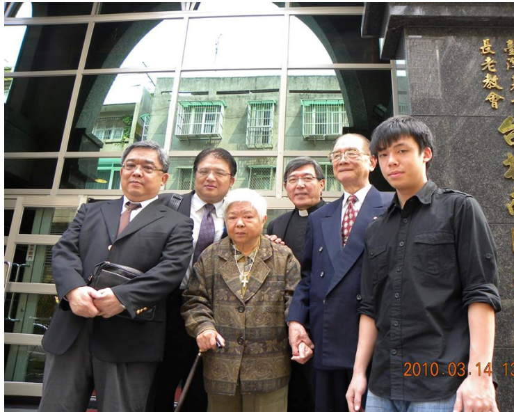
2010 年 3 月我們已經來南門 53 年了