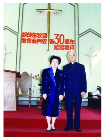
(1987 南門 30 年)

【紀念父親辭世 10 周年、母親 7 周年。本文同步刊登於台灣教會公報 3696 期】